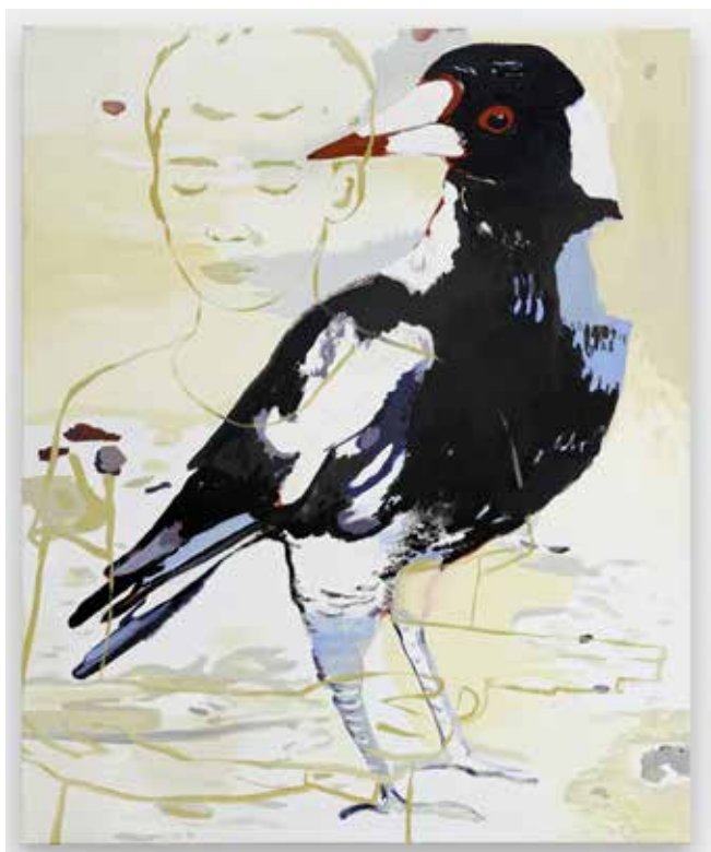
Françoise Pétrovitch, Verdure , 2017. Collection Frac Provence-Alpes-Côte d'Azur.

Françoise Pétrovitch, artiste française invitée en 2019 à investir le Louvre Lens, est aujourd'hui l'une des figures montantes de la scène artistique française. Cette exposition monographique que lui consacrent le Frac et la Métropole présente un corpus inédit de travaux sur papier, ainsi que les œuvres issues de la collection du Frac Provence-Alpes-Côte d'Azur et des lavis provenant de l'atelier de l'artiste.