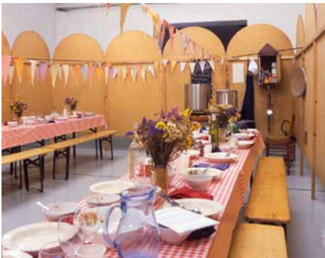
Patrick van Caekenbergh, Le Paravent , 1993. Collection Frac Provence-Alpes-Côte d'Azur © Adagp, Paris.

Patrick Van Caekenbergh fait figure d'o.v.n.i. dans cet art contemporain, bien trop lisse et brillant. Il affiche sans complexe son manifeste du bricolage. C'est de son père qu'il gagne ce don, lui qui ramassait les moindres petits clous et morceaux de bois dans la rue. Le cheval composé de boîtes, d'une table en bois, d'assiettes et de fourchettes en est l'illustration.