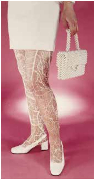
Natacha Lesueur, Sans titre , 1997, photographie contrecollée sur aluminium recouverte par un film plastique ultra brillant, 150 x 80 cm. © Adagp, Paris, 2019. Collection Frac Provence-Alpes-Côte d'Azur.

Cette exposition propose un panorama de démarches d'artistes qui utilisent, détournent, métamorphosent des objets du quotidien pour créer des œuvres qui se nourrissent de notre société de consommation. L'objet détourné pose la question d'un matériau neuf pour l'œuvre. De nouveaux actes et un nouveau vocabulaire (accumulation, assemblage, compression) apparaissent.