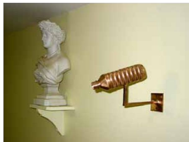
Exposition Villagesousurveillance 2 , 2005-2006, 20 caméras en bronze Installation de caméras dans les mairies de 13 villages, haute saône, France.

Sur le Fil (2) , Musée international d'art modeste, MIAM, Sète. (catalogue).