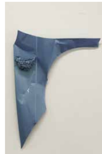
Nid d'aile , 2009, aile de voiture cabossée, nid d'hirondelle, résine pulvérisée, peinture carrosserie métallisée vernie.