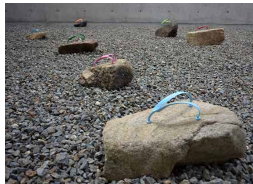
Armada 1 , 2013, 20 pierres de rivière, lanières de tong, dimensions variables, exposition «La mer secrète», Onomichi city museum of art, Japon.

FIAC, Galerie Martine et Thibault de la Châtre, Paris.