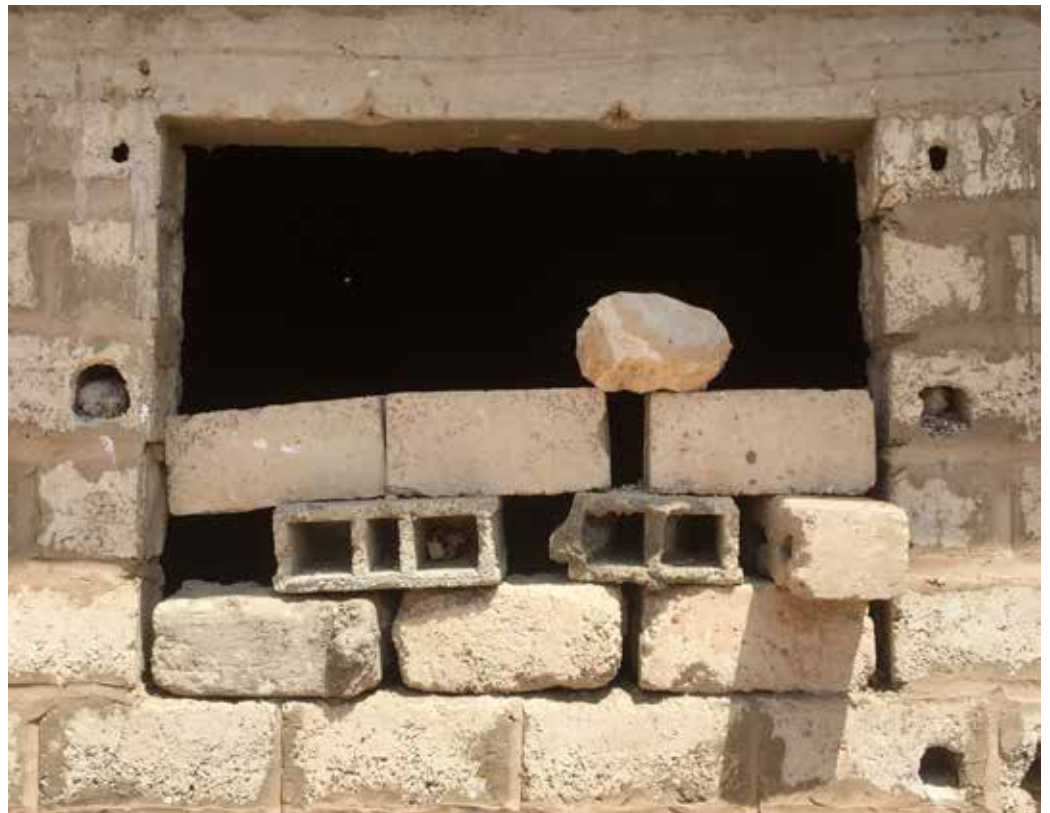
Sénégal, 2017 © Rodolphe Huguet

En partenariat avec la tuilerie Monier et le Frac Franche-Comté.