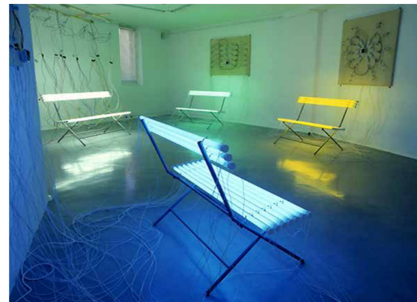
Salle d'attente (installation) , 2003, métal, fluos standards de couleur, bois, transformateur, fils électriques, installation, bancs de 120 cm et 150 cm, exposition YES, centre d'art de Istres, 2003.

FIAC, Galerie Martine et Thibault de la Châtre, Paris.