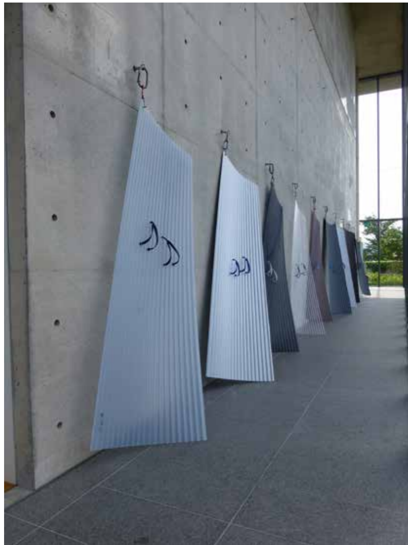
Surf people , 2013, tôles ondulées en pvc de couleurs, lanières de tongs, mousquetons et attaches de bateau, 12 x 2,4 m, exposition «La mer secrète», Onomichi city museum of art, Japon.

Hiroshima Art Document , Hiroshima, Japon.