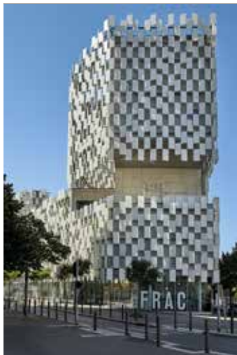
Le FRAC Provence Alpes Côtes d'Azur © Agence Kuma & Associates - Agence Toury Vallet. Photo JC Lett

Les Fonds régionaux d'art contemporain (Frac) sont des institutions qui ont pour mission de réunir des collections publiques d'art contemporain, de les diffuser auprès de nouveaux publics et d'inventer des formes de sensibilisation à la création actuelle. Créés en 1982 sur la base d'un partenariat État-régions, ils assurent depuis plus de trente ans leur mission de soutien aux artistes contemporains. Implanté à la Joliette, aux portes d'Euroméditerranée à Marseille, le Frac Provence-Alpes-Côte d'Azur est devenu un lieu emblématique de ce que nous appelons aujourd'hui un Frac « nouvelle génération » depuis l'inauguration en 2013 du bâtiment qui l'accueille, conçu par l'architecte japonais Kengo Kuma. Riche d'une collection de 1200 œuvres et représentant plus de 560 artistes, le Frac occupe aujourd'hui un territoire régional, national et international, et développe de nouveaux modes de diffusion pour sa collection à travers un réseau de partenaires. Véritable laboratoire d'expérimentation artistique, sa programmation s'inscrit dans un questionnement de notre société tout en permettant l'accès à l'art contemporain au sein des six départements de la région. Le Frac vous accueille toute l'année à Marseille et vous accompagne dans la découverte du bâtiment et des expositions qui rythment les saisons dans les murs.