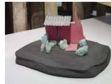
Maison de Mineur , 2012-2013, terre cuite, briques lapidées en quartz rose et onyx, bloc d'améthyste violette brute, tôle ondulée en argent, bois, contre plaqué, 34 x 33 x 13,5 cm.

Pièges à sieste , Le Vent des Forêts, Fresnes-au-Mont.