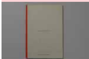
ZUBEIL Francine , Panique générale, 1993. Editions de l'observatoire, Marseille