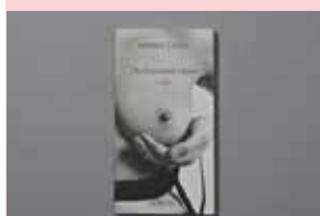
CALLE Sophie Des histoires vraies + dix, 2002 Actes Sud, Arles