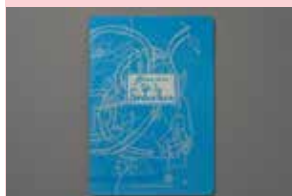
PETROVITCH Françoise , Album à colorier, de la séduction, 2002. Sémiose Galerie-édition, Paris

Les titres des vitrines sont extraits de l'ouvrage Fragments d'un discours amoureux de Roland Barthes, édition du Seuil, 1977