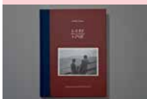
FELDMANN Hans-Peter, Liebe, 2006. Buchhandlung Walther König, Cologne