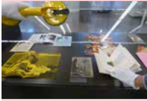
Visite vitrines ouvertes, samedi 21 avril à 15h

Visite vitrines ouvertes, samedi 21 avril à 15h sur réservation