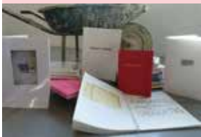
Atelier livres d'artistes, samedi 31 mars de 14h à 17h

Au magasin , retrouvez à la vente les éditions de Marc Quer parues en auto-édition ou aux éditions P.