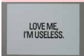
WATIER Eric, ULS Print #8, 2009 (U)L..S / (un)limited store, Marseille