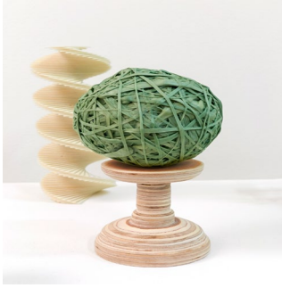
Globe 2, 2011 Chewing-gums et bois Collection Frac Provence-Alpes- Côte d'Azur.