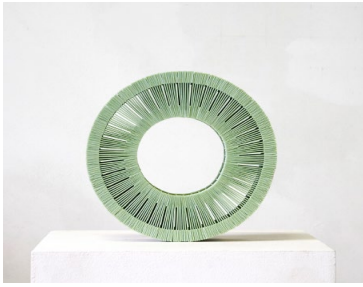
Relique 1 (11 phases de restauration), 2013 Tablettes de chewing-gum et samba diamètre 27 cm Collection Frac Provence-Alpes-Côte d'Azur

« Fondée sur des protocoles et des processus se développant selon des temporalités étirées ou fulgurantes, sur la répétition obstinée des actes et des procédures, la dimension performative du travail de Jérémie Laffon est manifeste. À l'énergie semblant dépensée en vain dans certaines vidéos, en lesquelles l'épuisement s'exhibe comme tel, répond la reprise de gestes productifs. Loin de toute conception idéaliste de la création, l'œuvre est tantôt montrée comme le résultat d'un labeur, tantôt comme l'occupation d'un dilettante. La pratique de l'artiste est faite d'allers-retours expérimentaux entre divers médiums, oscillant entre l'élaboration patiente et la destruction programmée. [...]